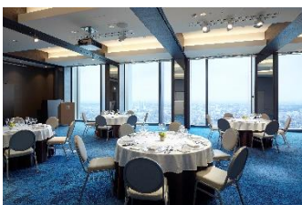
大宴会場 たまがわ