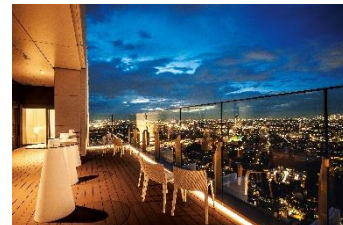
プライベートテラス